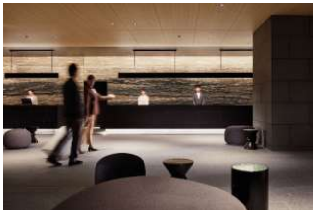
ザ・サウザンド京都 客室イメージ(左) ロビーイメージ(右)

【宿泊期間】 2025 年 4 月 11 日(金)チェックイン～5 月 12 日(月)チェックアウト