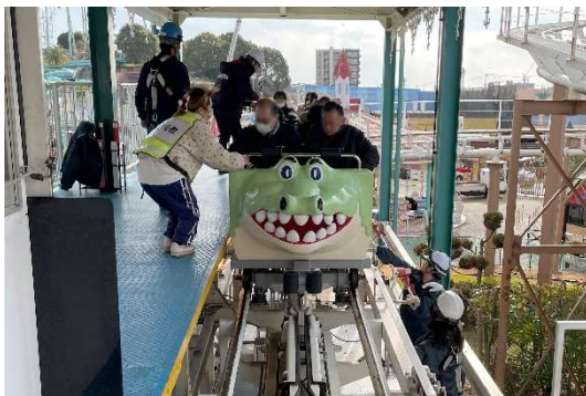
アトラクション乗り場にて降車救助を行う様子