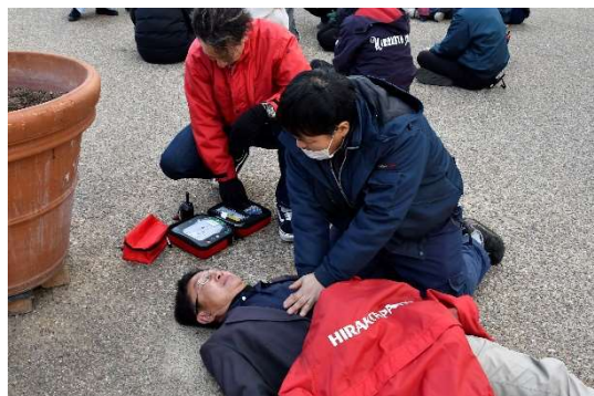
AEDによる人命救助の様子