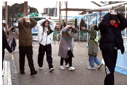
避難時の姿勢を指示しながら誘導する様子