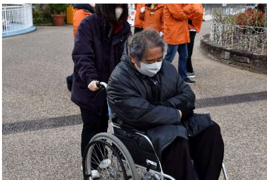
車いすを使った避難誘導の様子