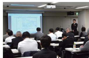
環境法規制セミナー