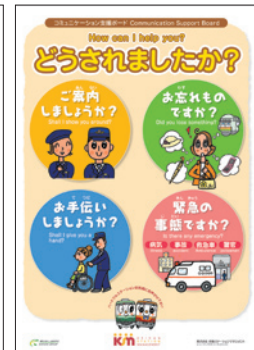
コミュニケーションボード“心のやりとり”