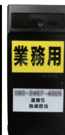
運行状況確認用携帯電話