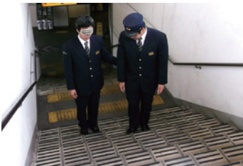
ヒューマンサポート研修

京阪線では、障がいのあるお客さまも快適に駅をご利用いただけるように新入社員にヒューマンサポート研修を実施しています。車いす、アイマスクなどを用いた実習を通じて、身体の不自由なお客さまが駅をご利用される際に感じる不自由さを知り、より良いサービスを提供できるよう努めることを目的としています。