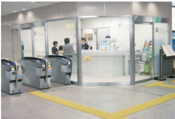
けいはんインフォステーション

京阪線の主要駅に「けいはんインフォステーション」を設置しています。列車ダイヤ、運賃、お忘れ物や駅周辺のご案内など、さまざまなお問い合わせにお答えしています。