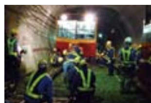
鋼索線の点検・整備