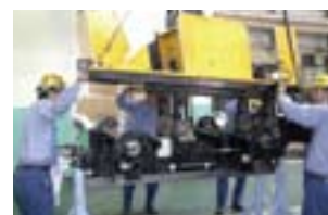
ジェットコースターの分解整備

当社が運営する「ひらかたパーク」では、鉄道技術部門が安全を確認し、さらに一部の遊戯機のメンテナンスを寝屋川車両基地で行っています。鉄道会社直営の強みを活かし、ひらかたパークと車両部門が協力し、高い技術レベルで遊戯機の安全を支えています。