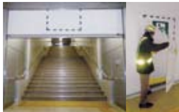
防火防煙シャッター