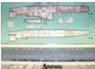
地下線防災監視盤

地下線には、各種の消火設備、排煙設備、避難誘導設備、通報設備、警報設備が設けられています。これら設備の状態や防災情報を24時間一元的に監視しています。