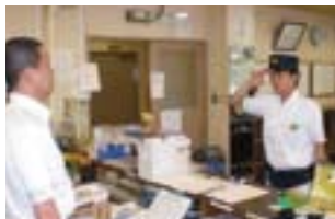
出勤点呼時アドバイス

また、運転指令者は、列車無線を使って天候などそのときの状況にあったアドバイスも行っています。