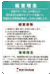
経営理念携帯カード

京阪グループ全従業員に経営理念、経営姿勢、行動憲章、環境理念を記載した携帯用のカードを配布しています。