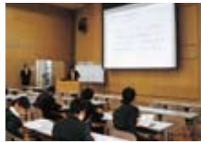
グループ新入社員研修

グループ新入社員研修、新任管理職・係長研修などで京阪グループの経営理念などの浸透を図っています。