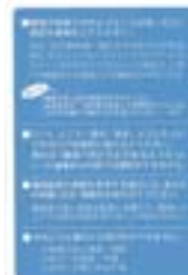
コンプライアンス・ホットラインカード

通報者の個人情報には厳重に保護され、コンプライアンス・ホットライン関与者など限定された者以外に開示されることはなく、通報行為によって不利益な処遇を受けることはありません。