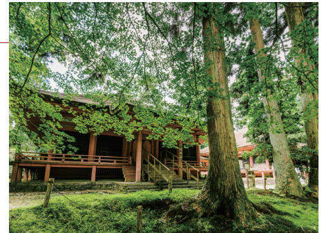
히에이잔 엔라쿠지 절

※로텔 드 히에이에서 유메미가오카, 교토방면으로는 이용하실 수 없습니다.