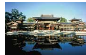
平等院(最寄駅:宇治)