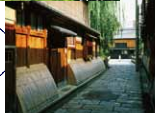
祇園(最寄駅:祇園四条)