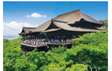
清水寺(最寄駅:清水五条)