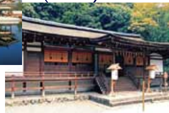
宇治上神社(最寄駅:宇治)