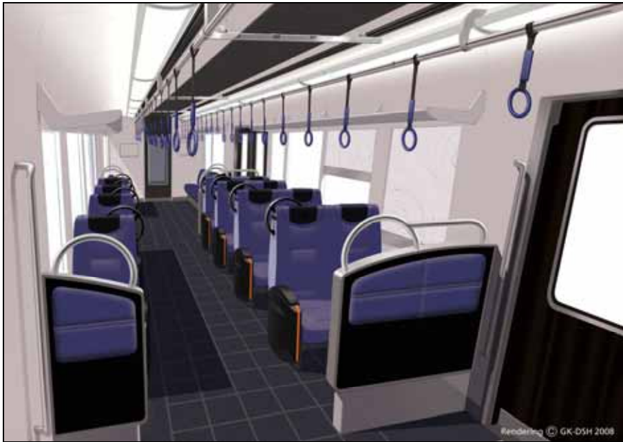
新型車両（車内イメージ）