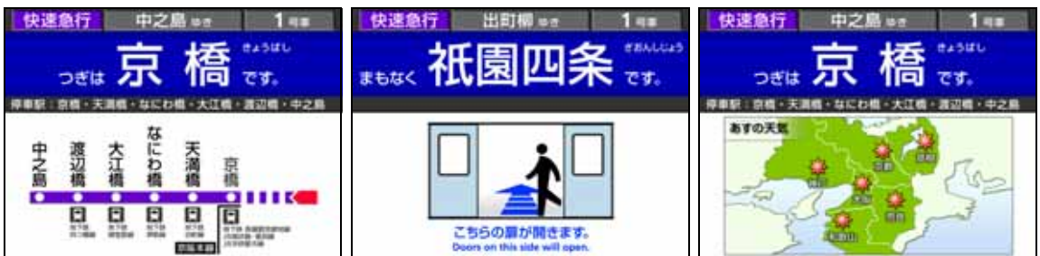
L C D表示器（画面イメージ）