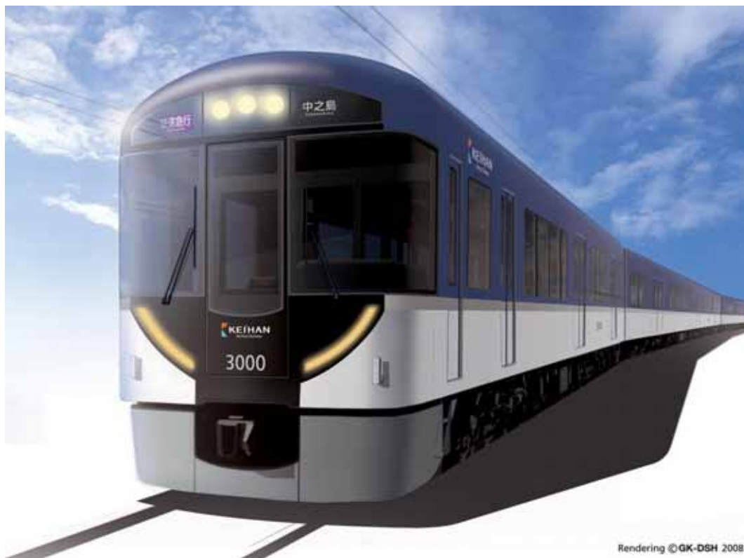
新型車両(外観イメージ)