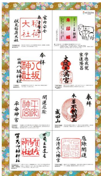
初詣朱印帳(京阪線)