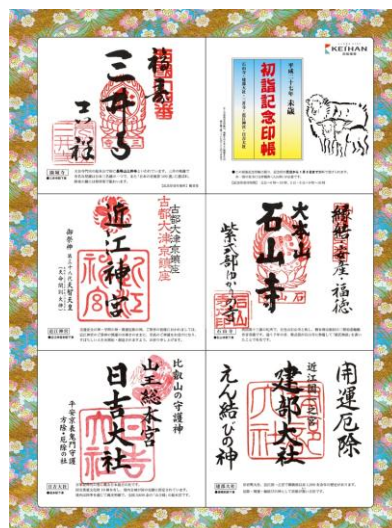
初詣記念印帳(大津線)