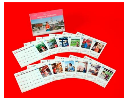
おけいはん卓上カレンダー