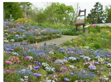
ガーデンミュージアム比叡 （園内「藤の丘」）