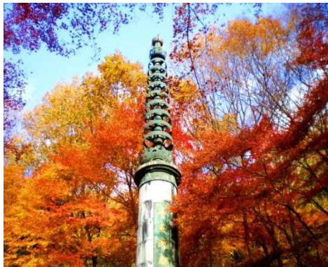
平安遷都千百年記念塔