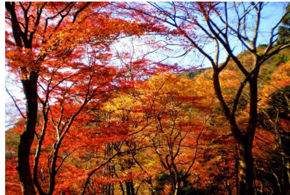
記念塔付近からの紅葉の景観 (平成25年11月撮影)