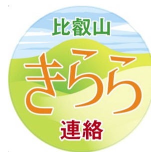
「比叡山きらら連絡特急」 特別ヘッドマーク