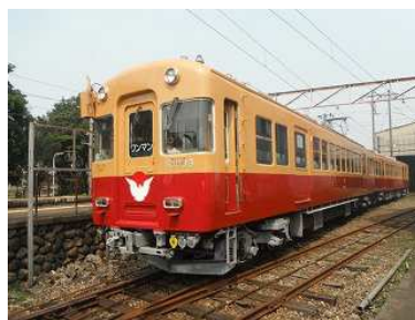
富山地方鉄道の旧3000系特急車 （京阪時代塗色に変更）