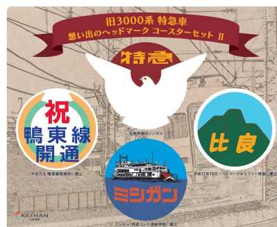
旧3000系特急車 思い出のヘッドマーク コースターセット II