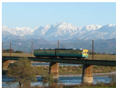
富山地方鉄道の旧3000系特急車 （「かぼちゃ電車」）

※平成24年7月5日現在、大井川鐵道の3000系車両は点検中のため運転しておりません（点検終了時期は未定です）。