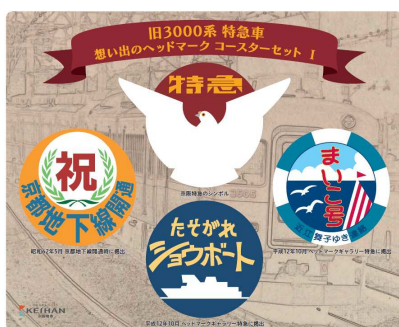
旧3000系特急車 思い出のヘッドマーク コースターセット I