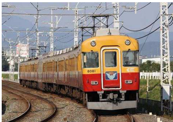
旧3000系特急車（現在は8000系30番台に改番）