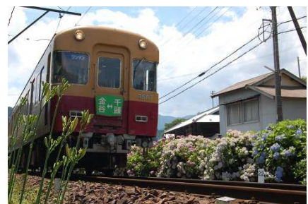
大井川鐵道の旧3000系特急車