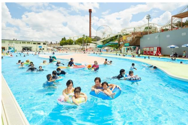
▲全長210mの巨大流水プール「ドンブラー」

今年は、事前予約することで、並ばずにプールサイドの快適な休憩スペースを確保できるサービス「有料レストスペース」が新登場。お客さまのニーズに合わせた6種類のシートからお選びいただけます。特に最上級の「プレミアムスイートテラス」は、高級感のあるプライベートな空間で、ゆったり過ごさせておすすめです。