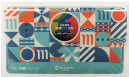
▲オリジナルマルチケース