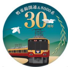
▲京阪電車開業 111 周年記念ミニチュアヘッドマーク 鴨東線開通 & 8000 系誕生 30 周年記念デザイン