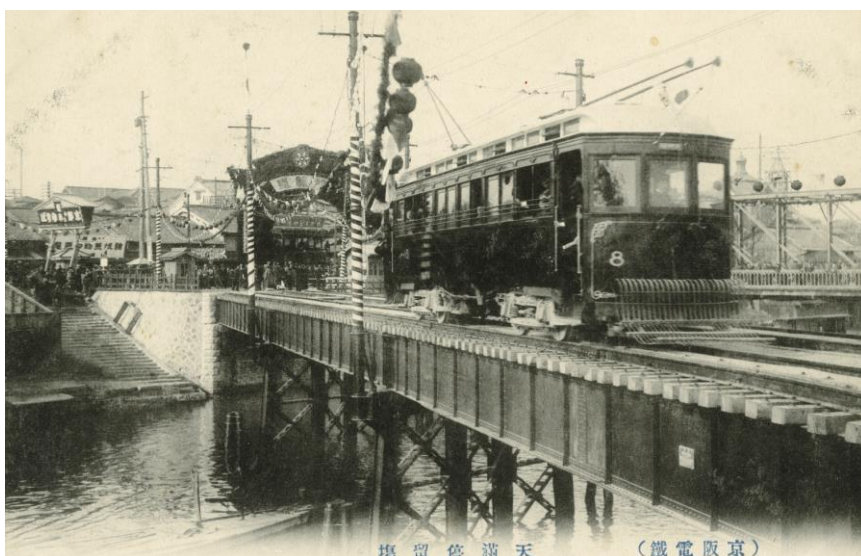
▲開業日の天満橋付近