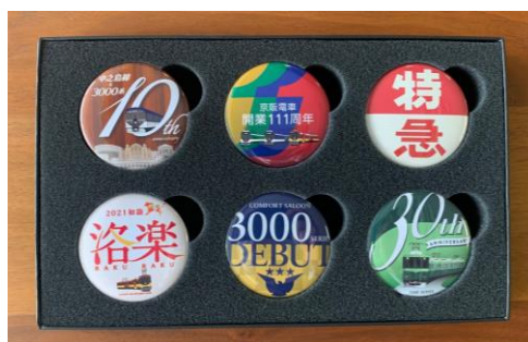
▲京阪電車開業 111 周年記念 ヘッドマーク缶バッジセット