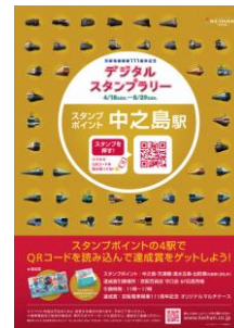
▲スタンプポイントポスター 中之島駅用 (イメージ)