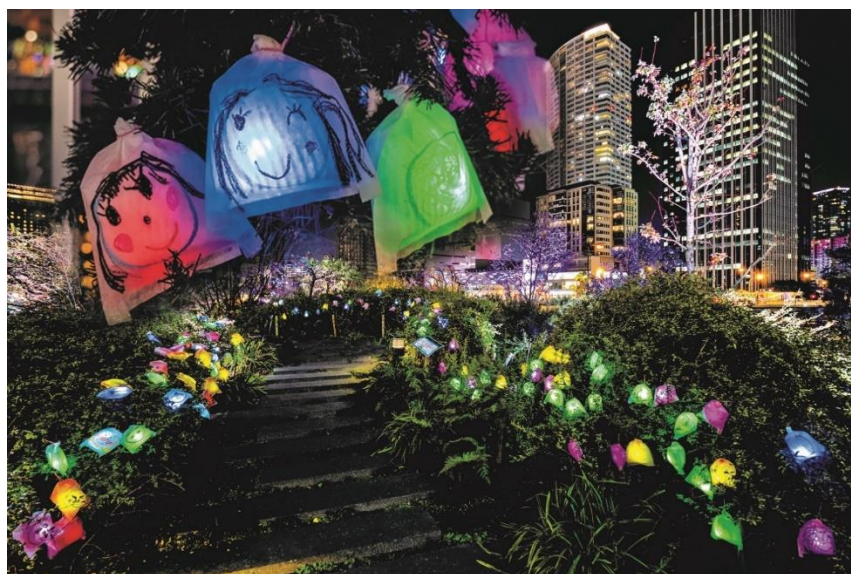
▲中之島ウエスト・スマイルアートプロジェクト「ひかりの実」(イメージ)

【主 催】 中之島ウエスト・エリアプロモーション連絡会(TEL: 06-6533-5833)