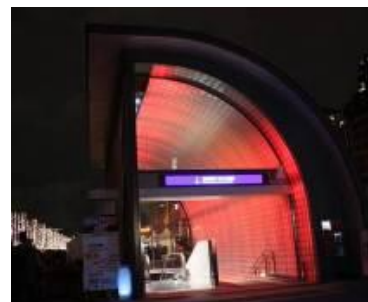
大阪市中央公会堂のレンガを象徴する“赤”