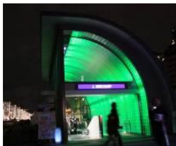
公園の木々を表す“緑”