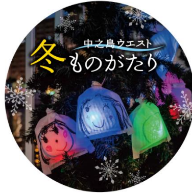
▲ヘッドマーク（新デザイン）

【内 容】 京阪線を走行する列車に「中之島ウエスト・冬ものがたり」のロゴをあしらったヘッドマークを掲出して運転します。