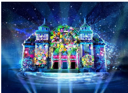
▲OSAKA光のルネサンス 「大阪市中央公会堂プロジェクションマッピング」 (イメージ)