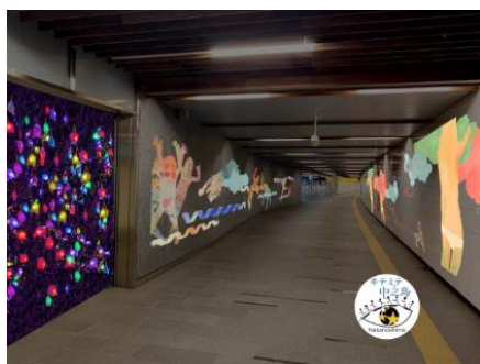
▲京阪電車中之島駅コンコース (イメージ)

また、「中之島ウエスト・冬ものがたり 2020」のメインプログラム「ひかりの実」との共同企画では、京阪電車大江橋駅の特設会場で開催しているワークショップ「中之島ウエスト・スマイルアートプロジェクト 大江橋駅で『ひかりの実』を作ろう！」(11/24まで開催)で制作した作品にLEDを入れ、「ひかりの実」としてシンボルツリーに装飾。みんなの愛と笑顔のメッセージを発信します。