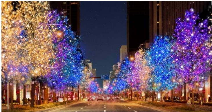
▲御堂筋イルミネーション(イメージ)