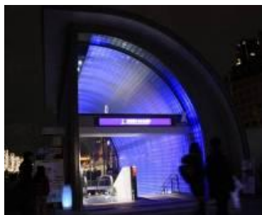
水都大阪を象徴する“青”

【内 容】なにわ橋駅の1号出入口(南西出入口)が、約30,000個のLEDにより幻想的な「光のゲート」に変身。水都大阪を象徴する“青”、公園の木々を表す“緑”、大阪市中央公会堂のレンガを象徴する“赤”の3色に次々と変化します。