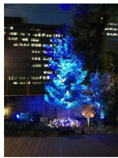
西天満若松浜 (なにわ橋駅下車)