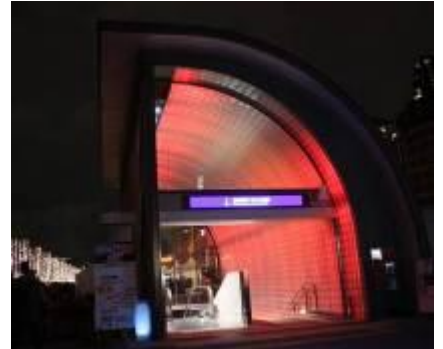
大阪市中央公会堂のレンガを象徴する“赤”