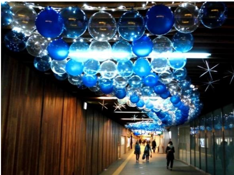
▲中之島駅の冬装飾(イメージ)