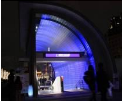
水都大阪を象徴する“青”