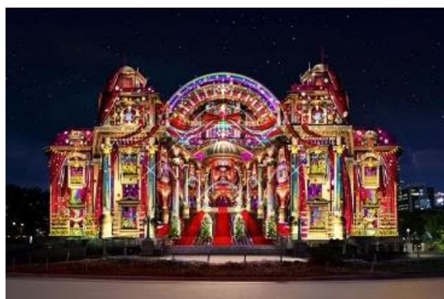
▲OSAKA光のルネサンス 2018 「ウォールタペストリー・大阪市中央公会堂 開館100周年記念公演～百年の輝き～」 大阪市中央公会堂東側正面／ 最寄り駅：淀屋橋駅(下車徒歩約5分)