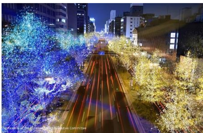
▲御堂筋イルミネーション 2018

【主 催】 大阪・光の饗宴実行委員会(T E L : 06-6910-1156)