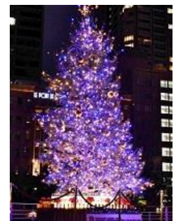
中之島公園芝生広場 (北浜駅下車)