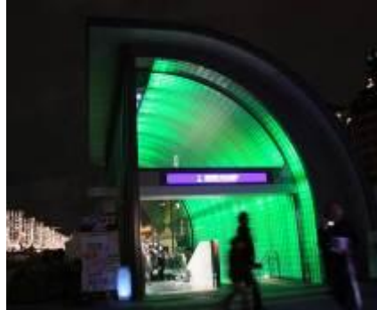
公園の木々を表す“緑”