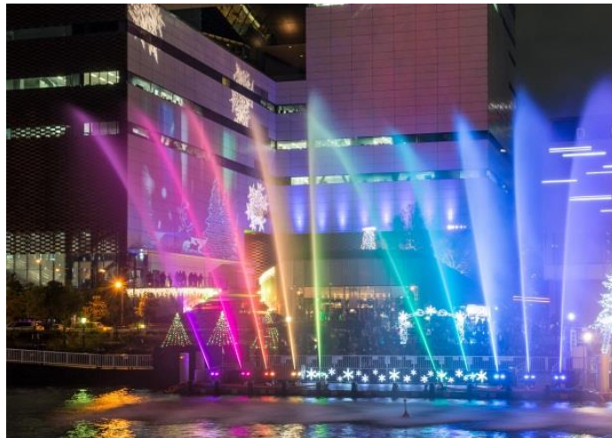
▲中之島ウォーターファンタジア 福島(ほたるまち)港周辺

【主 催】 中之島ウエスト・エリアプロモーション連絡会(TEL:06-6533-5833)