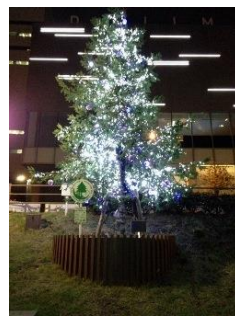
ほたるまち (渡辺橋駅下車)