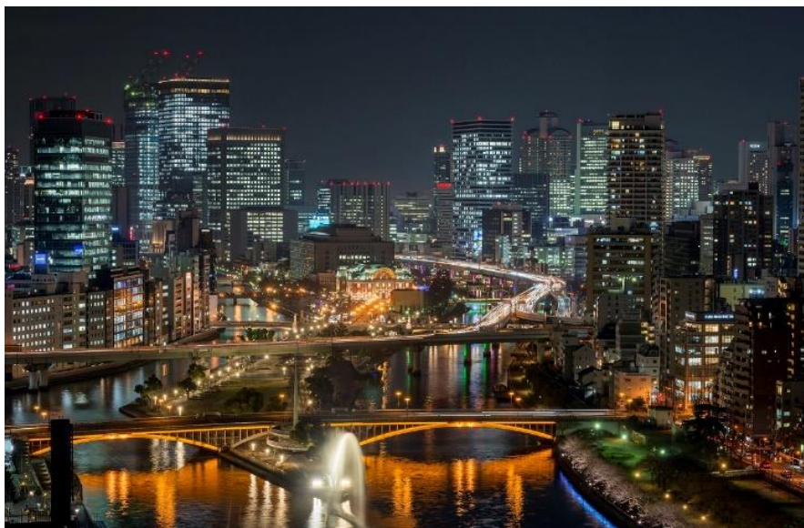
▲OSAKA光のルネサンス パノラマビュー OMM屋上スカイガーデン(西側)より/最寄り駅:天満橋駅(下車徒歩約3分)

【内 容】「OSAKA光のルネサンス」の美しい景観を一望できる展望スペースを、期間限定で特別開放します。極上のパノラマビューをお楽しみください。