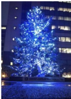
八軒家浜 (天満橋駅下車)