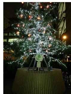
中之島バンクス (中之島駅下車)