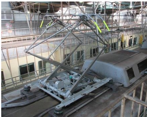
図 3 正常なパンタグラフ

異常時におけるパンタグラフの取り扱い方を見直します。パンタグラフと電車線との離隔距離が十分でない場合には、パンタグラフを切断する、または取り外すなどして安全を確保します。そして、係員が確実にそれを実践できるよう、教育・訓練を実施します。