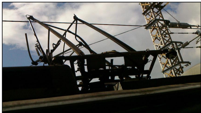
図 4 破損後のパンタグラフ(萱島駅 4 番線)