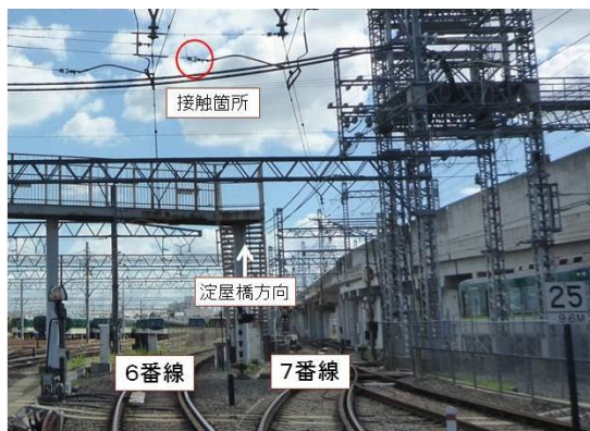
図 1 接触した曲線引装置