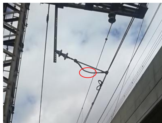
図 2 接触した振止装置