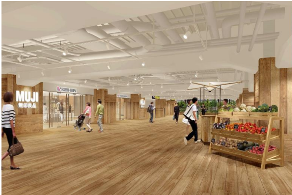
枚方市駅 中央口コンコース(イメージ)

また、駅案内サインや広告看板についても、掲出方法やレイアウトの見直し、デジタルサイネージの採用などにより、「心地よい空間」にふさわしいものへとデザインします。