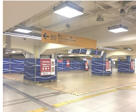
枚方市駅 中央口コンコース(現状)