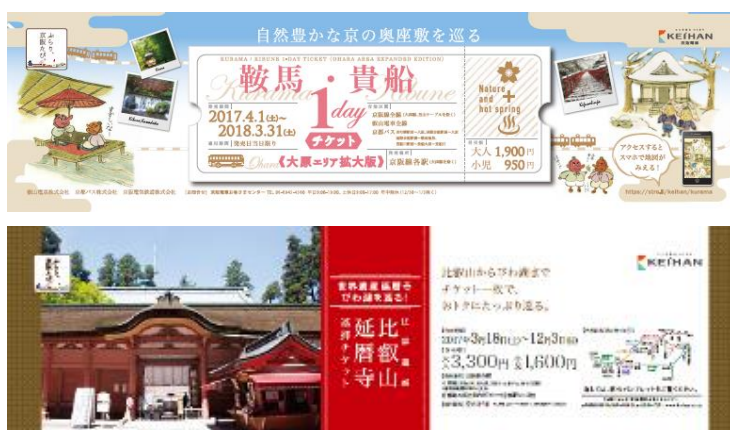
▲企画乗車券ラインナップの一例