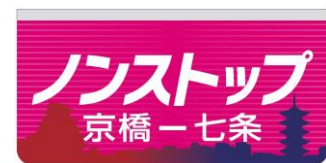
「京橋－七条間ノンストップ」表示