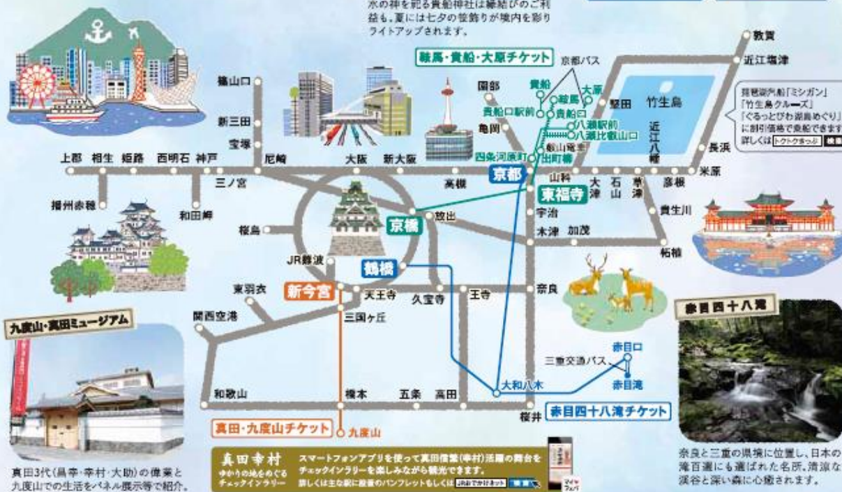
真田3代(黒幸・幸村・大助)の偉業と九度山での生活をパネル展示等で紹介。