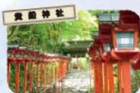
水の神を祀る貴船神社は縁結びのご利益も、夏には七夕の笹飾りが境内を彩りライトアップされます。

観光に便利なレンタサイクルも! 「夏の関西1デイパス」ご利用当日の1回に限り、レンタサイクル駅リンクくんが利用できます。詳しくは裏面をご覧ください。