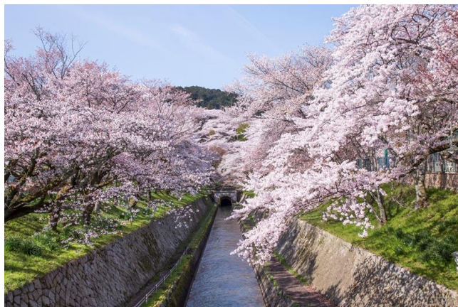
▲琵琶湖疏水（三井寺周辺）