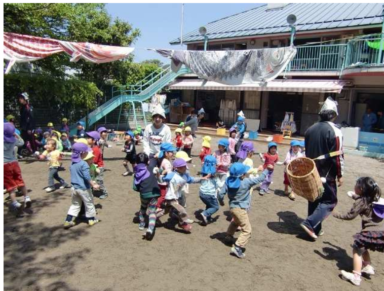
淀白鳥保育園の様子