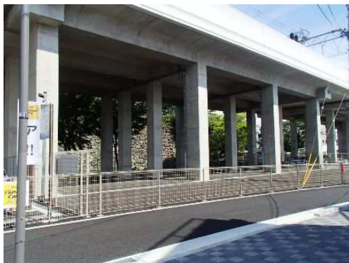
「淀白鳥保育園分園」建設予定地