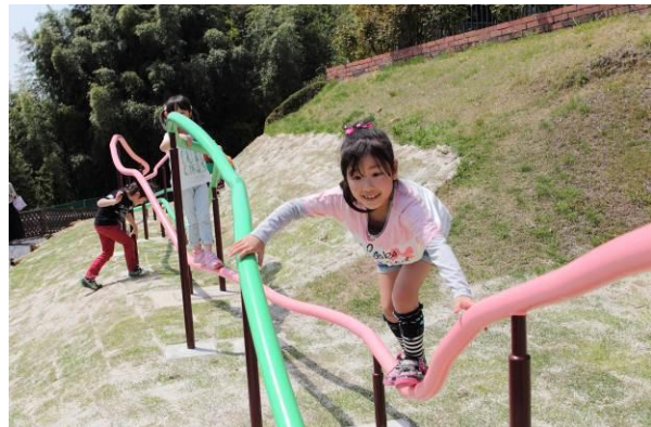
▲新アトラクション「あたま系アスレチック ヤッテミ～ナ」イメージ