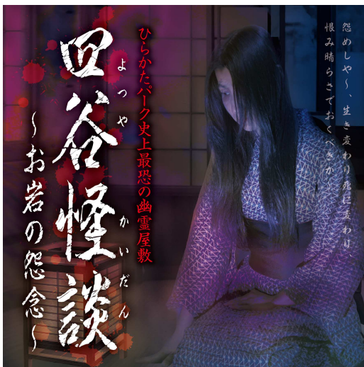
▲「四谷怪談 ～お岩の怨念～」 メインビジュアル

幽霊屋敷「四谷怪談 ～お岩の怨念～」ほか、ひらかたパーク夏シーズンの営業概要の詳細は、別紙のとおりです。