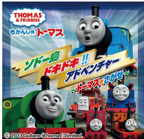
メインビジュアル