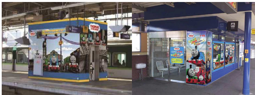
完成イメージ（左：枚方市駅、右：枚方公園駅）

【そ の 他】 交野線の乗換駅である枚方市駅と、ひらかたパークの最寄駅である枚方公園駅にも装飾を施します。