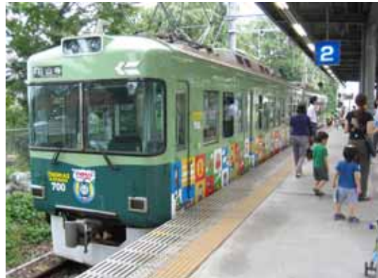
昨年度のラッピング電車（大津線）