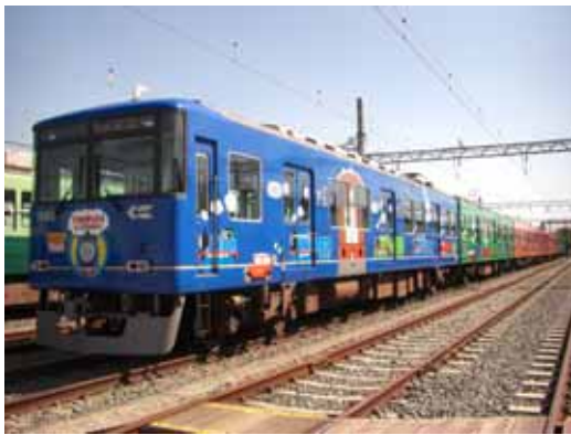
昨年度のラッピング電車（京阪線）

「600形きかんしゃトーマス号」 大津線600形 (619 - 620) 1編成