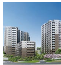
グランファースト千里桃山台