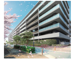
ファインフラッツ関目ザ・レジデンス