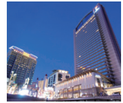
ホテル京阪 ユニバーサル・タワー ホテル京阪 ユニバーサル・シティ