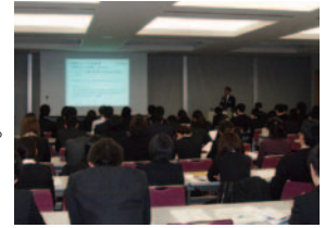
グループ新入社員研修

グループ新入社員研修、新任管理職・係長研修などで京阪グループの経営理念などの浸透を図っています。