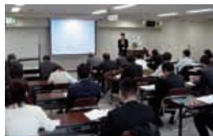
研修風景(法規制セミナー)