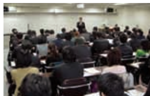
研修風景(新入社員研修)