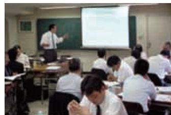
研修風景(内部環境監査養成研修)

当社は「京阪EMS年間スケジュール」に従い、毎年10月に監査室主導のもと各部門で選ばれた内部監査員が相互に内部環境監査を実施しています。9月には内部監査員養成研修を行い、平成18年度は22名の内部監査員を養成しました。平成19年3月31日現在、内部監査経験者は約80名で自部門での環境活動に生かしています。